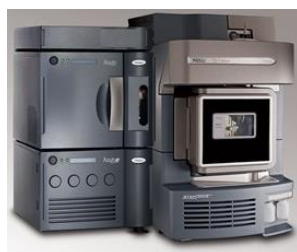
nanoUPLC-XEVO TQS SYSTEM™

Monitoraggio qualitativo e/o quantitativo di specifici biomarcatori proteici