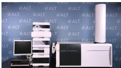
LC-MSMS Q-TOF AGILENT 6530 SYSTEM™