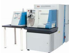
LC-MSMS nanoUPLC-LTQ Orbitrap XL SYSTEM™