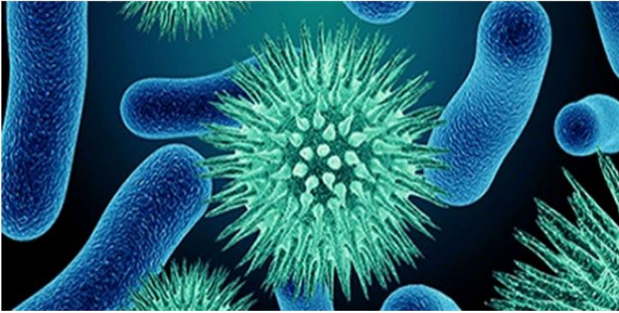
Lactobacillus paracasei CBA L74 previene le infezioni virali e batteriche nel bambino

I ricercatori del CEINGE-Biotecnologie avanzate di Napoli, guidati da Roberto Berni Canani, uno dei massimi esperti nel campo della gastroenterologia e nutrizione pediatrica, in collaborazione con i ricercatori dell'Università di Milano e dell'Humanitas hanno dimostrato per la prima volta la possibilità di prevenire gli squilibri a carico di microbioma intestinale e del sistema immunitario indotti dal parto operativo e dall'assenza di latte materno in neonati allattati con una formula contenente un innovativo prodotto di fermentazione.